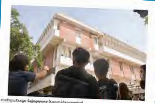
ការអភិរក្សបេតិកភណ្ឌ និងវប្បធម៌ខ្មែរថ្មី ម៉ាក់ ម៉ូលីបុទ្ធា ភ្នំពេញ