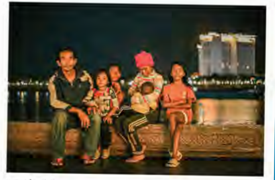
គ្រួសារមួយដែលកក់ក្តៅ សុត សុផីលី ខេត្តកណ្តាល

«និស្សិតស្ថាបត្យកម្ម ស្វែងយល់អំពីស្ថាបត្យកម្មខ្មែរថ្មី» «ស្ថាបត្យកម្មខ្មែរថ្មី គឺជាវិធីសាស្ត្រនៃឯករាជ្យភាពថ្មីរបស់ប្រទេសកម្ពុជា និងបំណងប្រាថ្នាដើម្បីធ្វើទំនើបកម្ម។ ចលនានេះគឺជាការលាយបញ្ចូលគ្នានៃស្ថាបត្យកម្មខ្មែរបុរាណ និងរចនាបថអន្តរជាតិទំនើប ដោយអបអរសាទរវេទនាបេតិកភណ្ឌវប្បធម៌ដ៏សម្បូរបែបរបស់កម្ពុជា។ រូបថតនេះចាប់យកពេលមួយដែលសិស្សជំនាន់ក្រោយ កំពុងចាប់អារម្មណ៍ក្នុងការស្វែងយល់ពីបេតិកភណ្ឌជាតិ ដោយសម្លឹងមើលអគារវិទ្យាស្ថានភាសាបរទេសសាកលវិទ្យាល័យភូមិន្ទភ្នំពេញ។ រូបថតនេះគឺជាការម្នឹកពីសារៈសំខាន់នៃការអប់រំយុវជនអំពីបេតិកភណ្ឌនិងវប្បធម៌របស់ពួកគេ។ វាក៏ជាការអបអរសាទរដល់យុវជនដែលធ្វើតពេលសិក្សាស្វែងយល់ និងថែរក្សាស្ថាបត្យកម្មខ្មែរថ្មី ដោយបង្ហាញពីការស្វែងយល់អំពីអតីតកាល ដើម្បីសាងសង់អនាគតដ៏ល្អប្រសើរសម្រាប់កម្ពុជា។» ម៉ាក់ ម៉ូលីបុទ្ធា ភ្នំពេញ