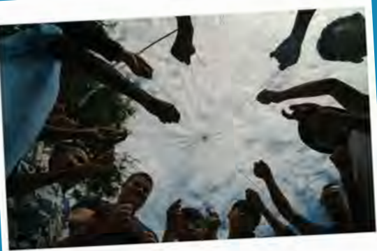
យើងតែមួយ អ៊ូ បាណុង ភ្នំពេញ